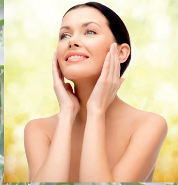
Alogen®-Präparate gibt es exklusiv von der DS-Pharmagit GmbH